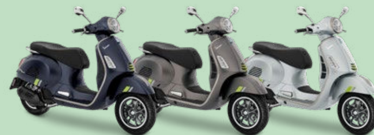
AZUL ENERGICO MATE